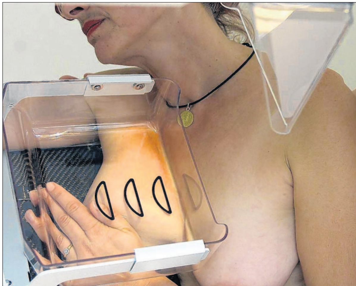
Nicht angenehm, aber für die Früherkennung von Brustkrebs sehr wichtig: die Mammographie, bei der von jeder Brust je zwei Röntgenaufnahmen erstellt werden.

Mit der Einladung zur Mammogra- phie wird auch gleich ein Terminvor- schlag mitgeteilt – und wo dieser bei Annahme des kostenfreien Angebotes wahrgenommen werden kann, wofür auch weder eine Praxisgebühr fällig, noch eine Überweisung erforderlich ist. In den mit modernster Technik ausgestatteten Screening-Zentren er- stellt eine geschulte Fachkraft je zwei