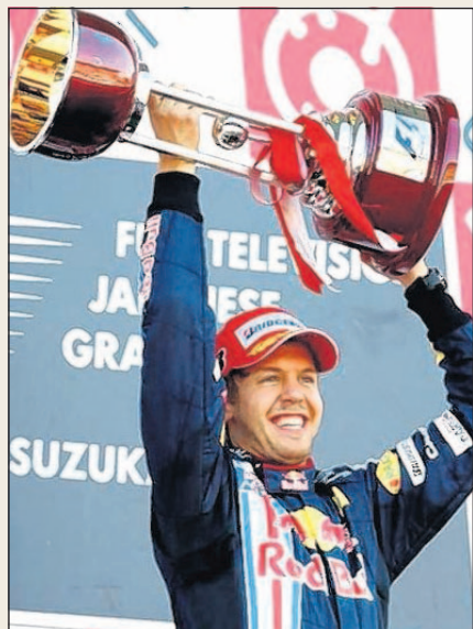
Stolzer Gewichtheber: Sebastian Vettel mit dem Siegerpokal von Suzuka.

Start-Ziel-Sieg: Sebastian Vettel gewinnt GP von Japan in Suzuka